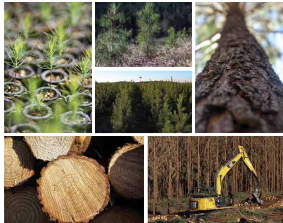
Seqüência de fotos com diferentes fases do plantio a colheita das florestas