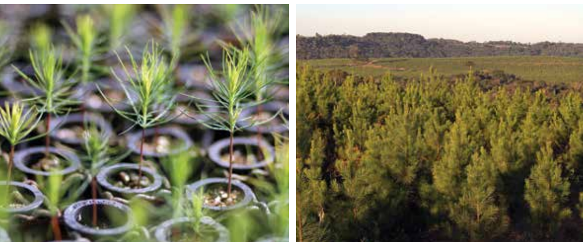
Produção de Mudas e Visão Área de Plantio Faz. Buriti

Há na unidade de manejo florestal da Fazenda Buriti, plantios com Araucária angustifolia e Cryptomeria japonica , sendo estes adquiridos junto com a aquisição da fazenda no ano de 1987. A área de cultivo destas espécies são respectivamente 64,29 e 0,35 hectares.