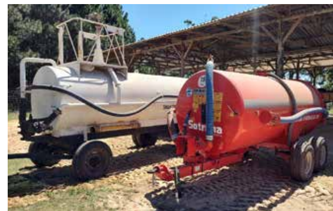
Tanque móvel utilizado para combate à incêndios.

• Treinamento contínuo dos funcionários quanto ao procedimento operacional de combate a incêndios florestais.