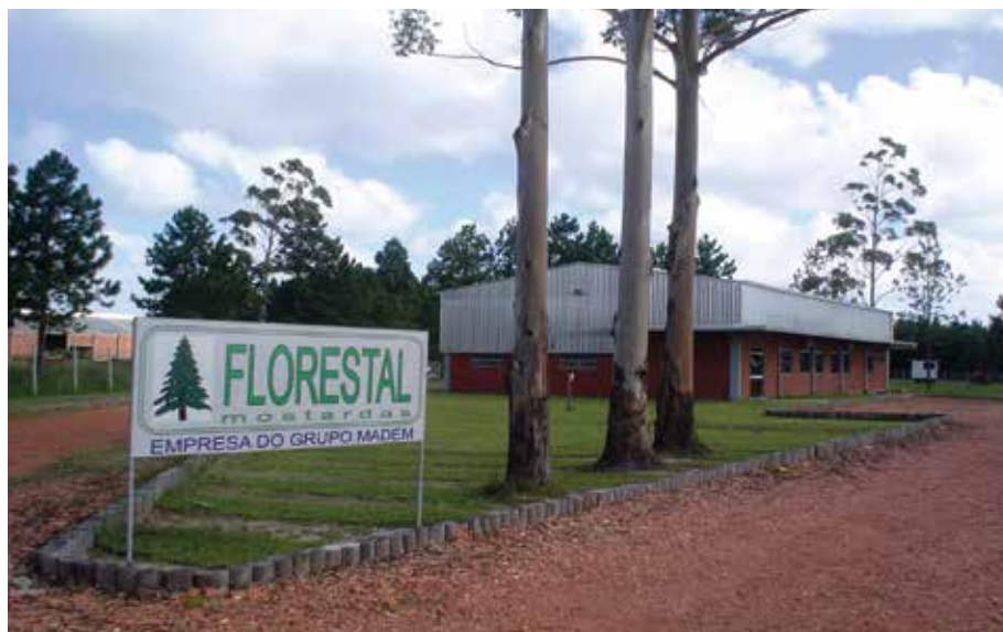
Sede da empresa localizada no Km 160 da Rodovia BR 101.

Sediada no município de Mostardas no Litoral sul do Estado do Rio Grande do Sul, a empresa faz parte do Grupo MADEM, hoje com 74 anos de história, estando entre os maiores grupos florestais do Brasil, sendo líder mundial na fabricação de bobinas de madeira para indústria de cabos elétricos.