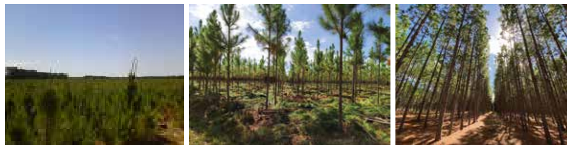
Seqüência de fotos com diferentes fases de povoamentos provenientes da regeneração do Pinus elliottii na Florestal Mostardas.

Ao iniciar a segunda rotação destas áreas, após a primeira colheita, já na década de 90, deparou-se, com a capacidade de germinação espontânea do banco de sementes depositado no solo da floresta. Adaptando-se a nova realidade, foram desenvolvidas técnicas de manejo no sentido de aproveitar este potencial na formação de novos povoamentos, partindo para o conceito de rigorosa seleção fenotípica de indivíduos, conciliando a metodologia adotada com a viabilidade econômica do manejo.