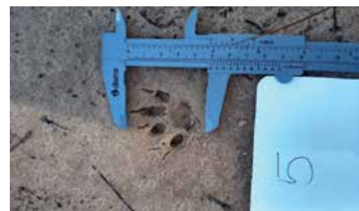
Figura 6 - pegada de Leopardus spp.