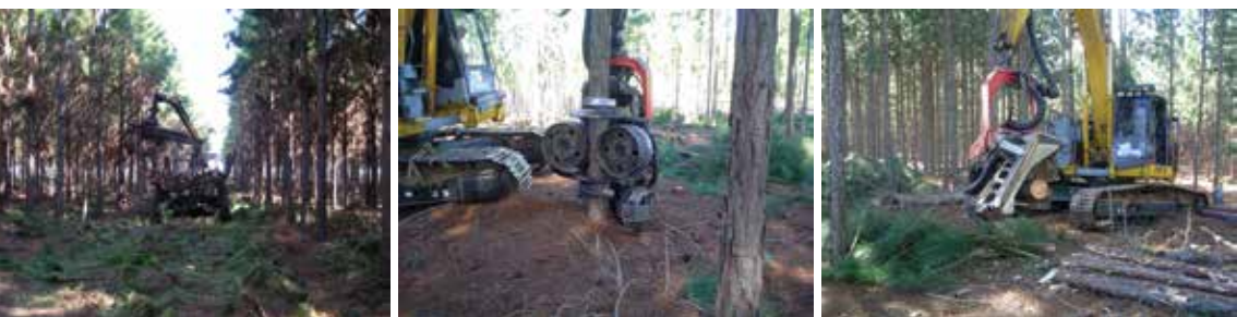
Sequência de fotos com diferentes etapas da colheita: corte, seccionamento e baldeio, em operação de Desbaste.