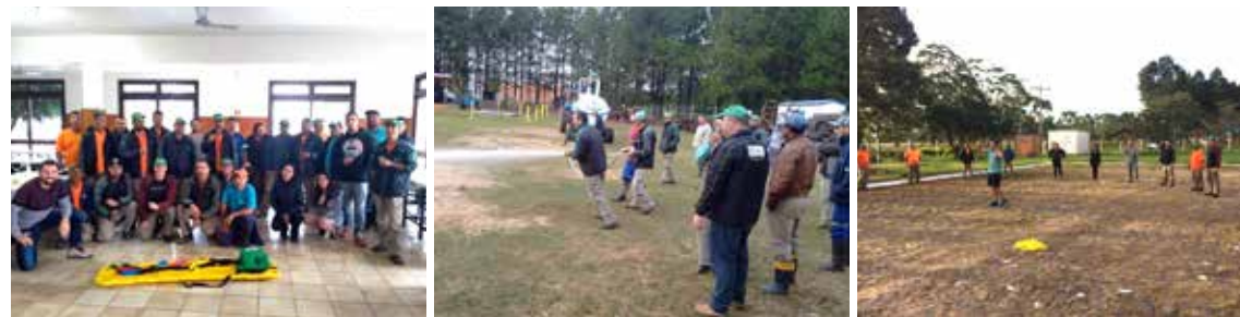
Treinamentos Florestal Mostardas de Ginástica Laboral, Primeiros Socorros e diálogos de segurança

Boa parte dos cursos de capacitação são realizados com a parceria e apoio do SENAR (Serviço Nacional de Aprendizagem Rural) juntamente com o Sindicato Rural de Mostardas.