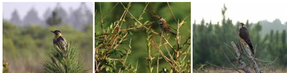
Aves avistadas em campo e florestas de Pinus nas áreas da empresa: Pica-pau-do-campo ( Colaptes campestris ), Tico-tico ( Zonotrichia capensis ), Falcão-de-coleira ( Falco femoralis ).

Participa também, por termo de cooperação através da AGEFLOR, junto ao Instituto de Pesquisas e Estudos Florestais (IPEF) onde contribui para o projeto de pesquisa chamado Programa Cooperativo de Certificação Florestal (PCCF). O referido programa busca ser o elo entre as empresas certificadas, ONGs, organismos de certificação, universidades, instituições de pesquisa, fornecedores de insumos e serviços e demais partes interessadas no processo de certificação florestal, para o tratamento dos assuntos de interesse de todos.