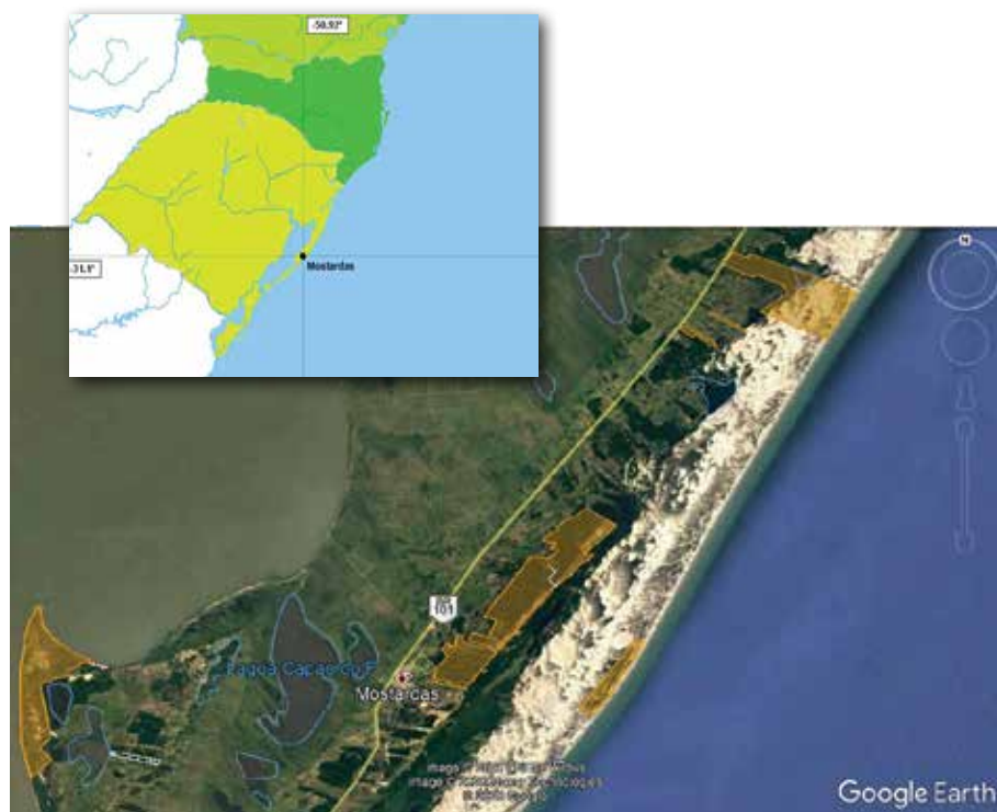
Figura 2 - Hortos florestais da Florestal Mostardas localizados no município de Mostardas-RS.

A seguir estão identificadas as fazendas presentes no escopo da Certificação de Manejo Florestal FSC Florestal Mostardas (Figura 2).